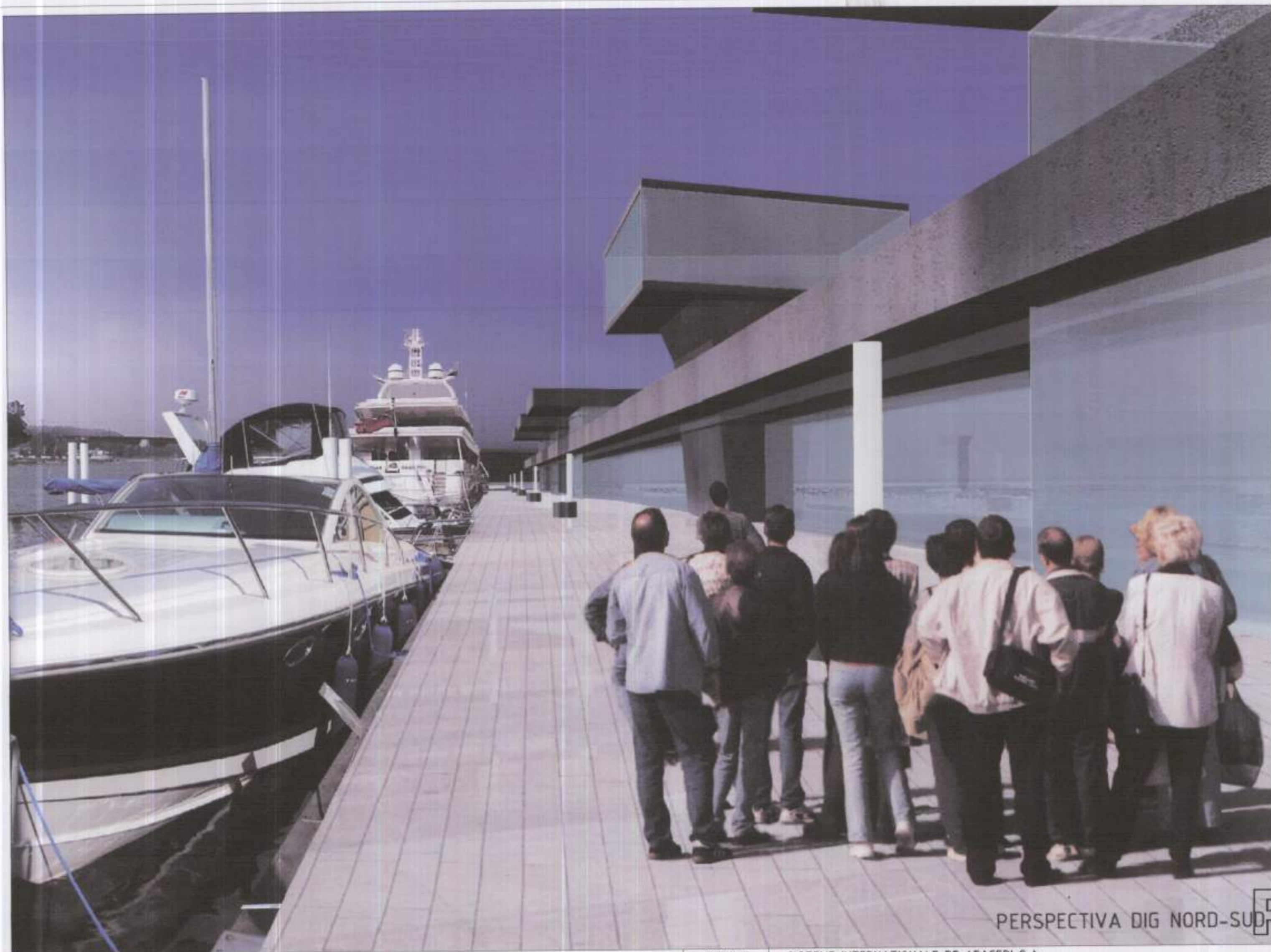
PERSPECTIVA DIG NORD-SUD PUD