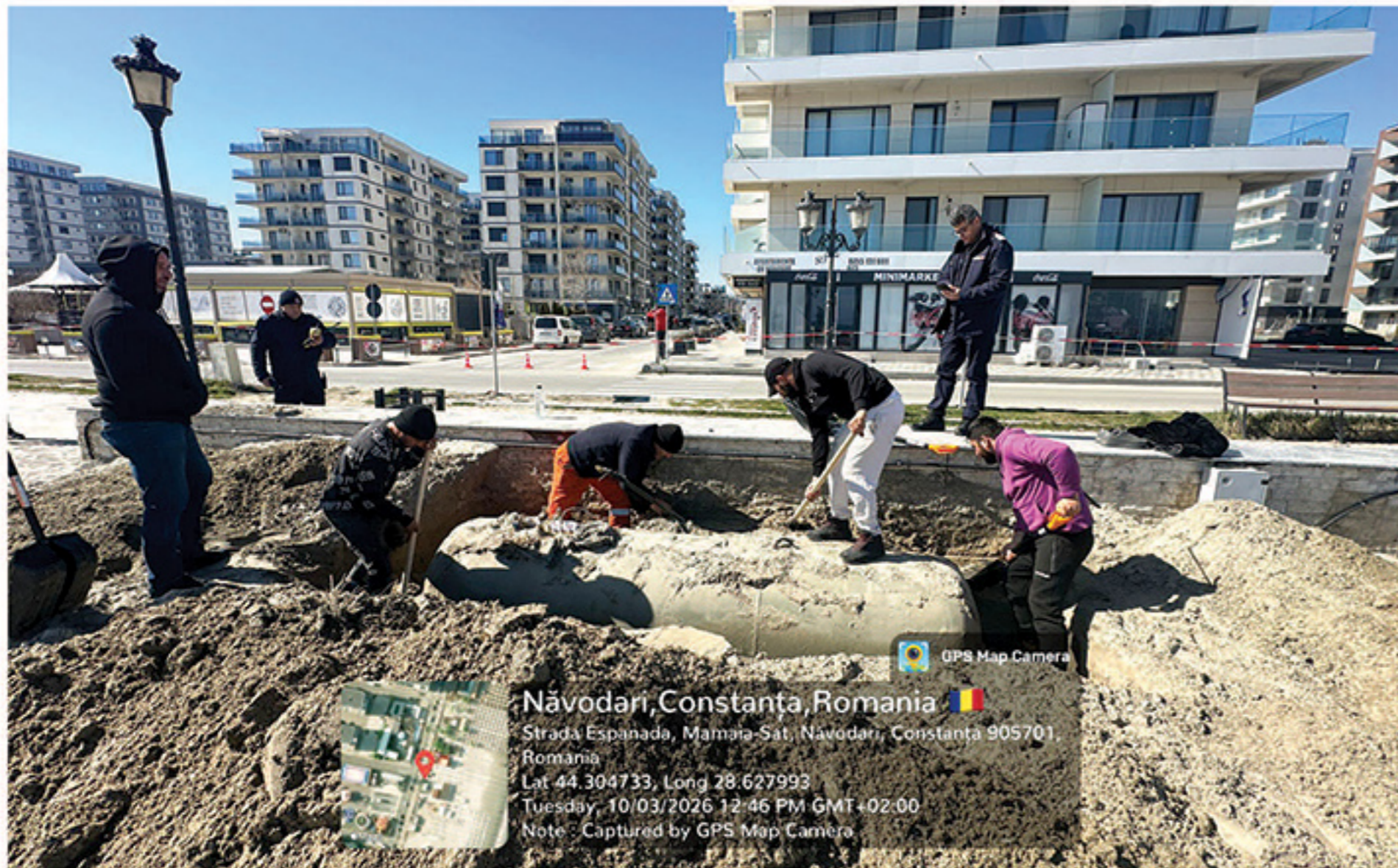
Năvodari, Constanta, Romania Strada Espanada, Mamaia-Sat, Năvodari, Constanta 905701 Romania Lat 44.304733, Long 28.627993 Tuesday, 10/03/2026 12:46 PM GMT+02:00

Ies detalii noi în cazul scandalului iscat după ce un rezervor cu gaz a fost găsit îngropat în nisip, pe plajă, în zona fostei terase Lujo din Năvodari. Inițial, toată vină a fost aruncată pe umerii societății care administra terasa, în speță Joshua Leader Invest SRL, însă trebuie menționat